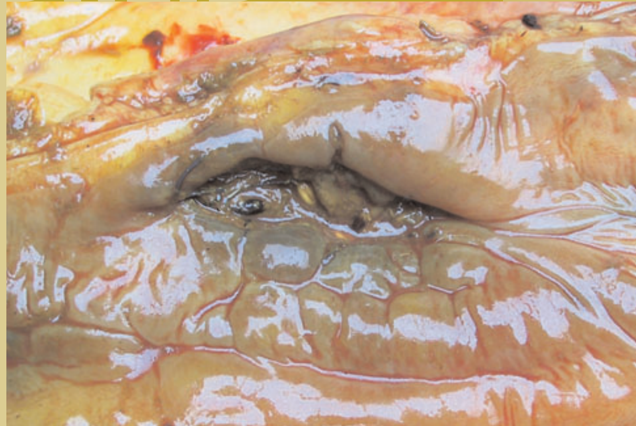
▲ Scheur in het rectum gezien vanuit de slijmvlieskant.

Een rectumbeschadiging is een beschadiging aan het laatste deel van de endeldarm van het paard. Beschadigingen in dit gebied kunnen optreden bij het zogenaamde rectaal exploreren (aftasten van de buikorganen), beter bekend als opvoelen. In het dekseizoen vindt dit opvoelen regelmatig plaats bij merries, maar ook bij paarden met koliek is het een veelvuldig toegepaste handeling om meer te weten te komen van de problemen van de patiënt. Een enkele keer ontstaat een rectumbeschadiging bij het dekken of afveulen van de merrie. Slechts heel zelden