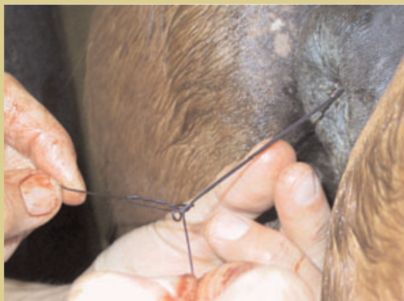
Bij het hechten van een rectumbeschadiging kan er buiten de anus een knoop gelegd worden die dan vervolgens opgeschoven wordt.