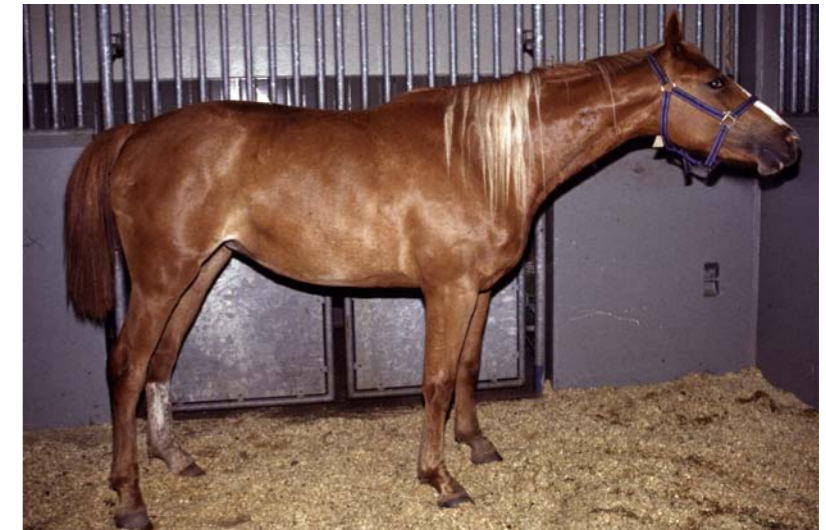
De stijve spieren van hoofd, hals en benen maken het van de grond eten erg moeilijk of zelfs onmogelijk.

Hoe sneller de symptomen van tetanus ontstaan, hoe slechter de kansen voor het paard. Als het paard langzaam in week verslechterd zijn de kansen op herstel wat beter.