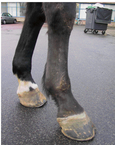
Gelocaliseerde sarcoïdose RV bij een 7-jarige KWPN merrie.

gen op de voorgrond: schilferige huidlaesies met verlies van haar waarbij de manen en de staart gespaard blijven. Een huidbiopt zal hier de diagnose bevestigen. Bij de nodulaire vorm vertoont de huid in eerste instantie geen afwijkingen, maar worden er overal onderhuidse (subcutane) zwellingen waargenomen. Een speciaal type biopt (trucut) zal hier een diagnose geven. In beide gevallen treedt in het verloop van de aandoening ook verminderd presteren en vermageren op. Bij de huidvorm treedt later in het verloop van de aandoening ook weefselwoekering (granuloomvorming) in organen op en bij de nodulaire vorm gaat de huid doorgaans later ook meedoen.