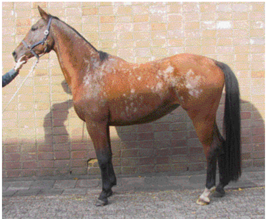
Gegeneraliseerde sarcoïdose bij een 11-jarige Trakener merrie.

Bij gegeneraliseerde sarcoïdose kunnen twee klinische beelden op de voorgrond treden. Bij de huidvorm treden vooral de huidveranderingen