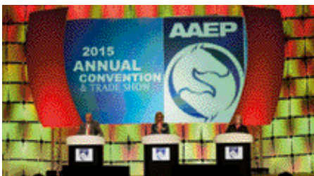
Het jaarlijkse AAEP congres in Las Vegas is een van de grootste bijeenkomsten voor dierenartsen