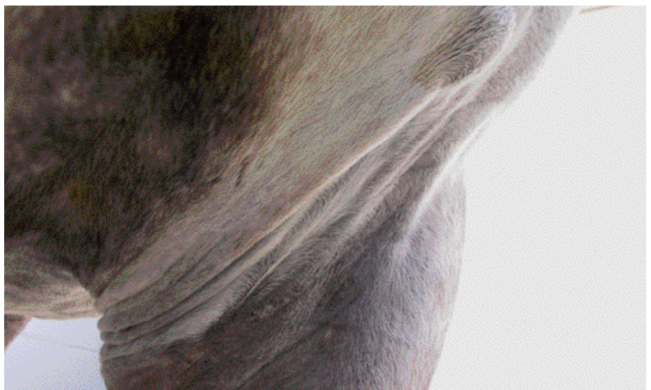
Partieel gegeneraliseerde sarcoïdose bij een 12-jarige KWPN merrie, de huid aan de binnenzijde van de radius is aangetast en er is een bult in de voorborst.

Er is geen voorkeur voor ras, geslacht of leeftijd. De diagnose wordt met zekerheid gesteld door middel van een huidbiopsie waarin een voor de patholoog heel duidelijk afwijkend beeld optreedt (een nodulaire of meer diffuse granulomateuze dermatitis met vaak forse aantallen meerkernige reuscellen van het Langhans type). Hoewel in de literatuur wordt beschreven dat gelokaliseerde sarcoïdose zich eigenlijk altijd uitbreidt tot gegeneraliseerde