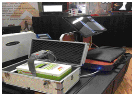
Op de beurs worden de nieuwste ontwikkelingen getoond.

De avonden werden benut om de stad te ontdekken en contacten te leggen met collega's. In dezelfde periode vonden ook de finales van de nationale kampioenschappen Rodeo plaats in Las Vegas. Op dezelfde locatie waar in april nog de wereldbeker springen en dressuur plaatsvond werd de piste nu gevuld met quaterhorses, mustangs en stieren. Een tot de nok gevulde arena gilde, joelde en stampte om hun favorite cowboys aan te moedigen. Al met al was het verblijf in Las Vegas een leerzame en gezellige ervaring. ●